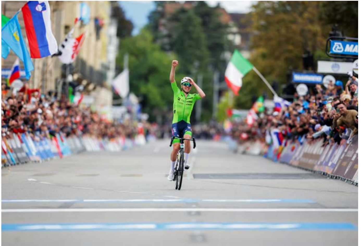
Der Slowene Tadej Pogačar siegt souverän nach einer langen Solofahrt.