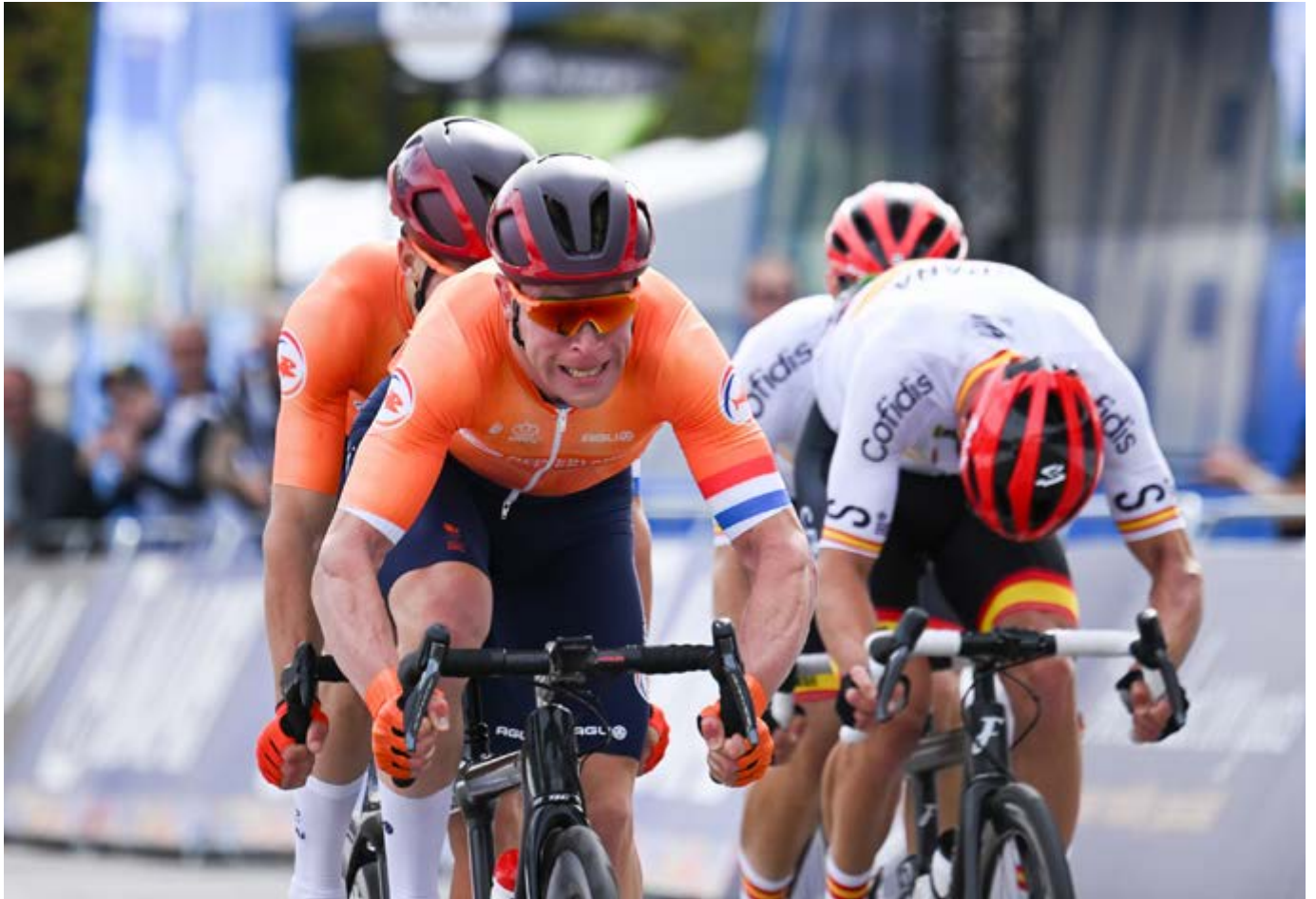
Das niederländische Tandemteam (links) gewinnt das MB-Strassenrennen vor dem spanischen Duo.