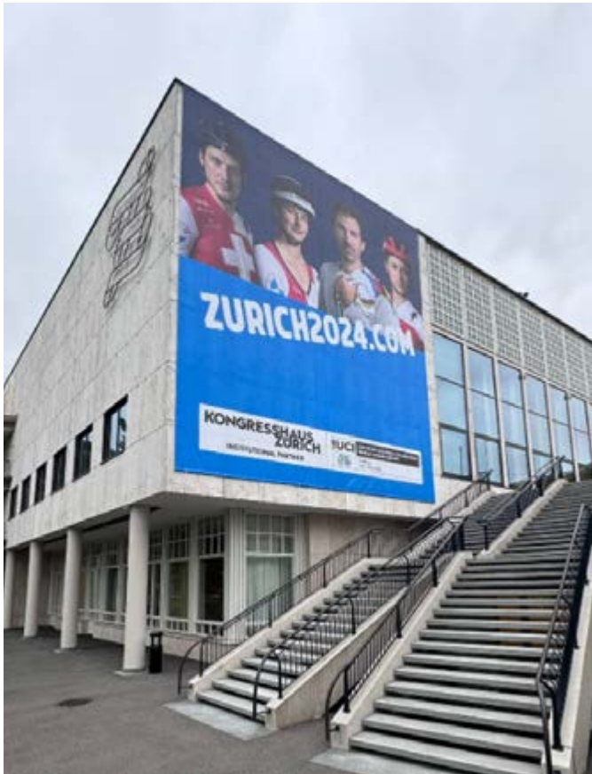
Highlight des Host City Dressing war das Megaposter am Kongresshaus.