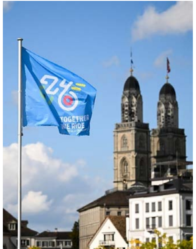
Die Beflaggung entlang des Utoquais und der Quaibrücke war Teil des Eventerscheinungsbilds.