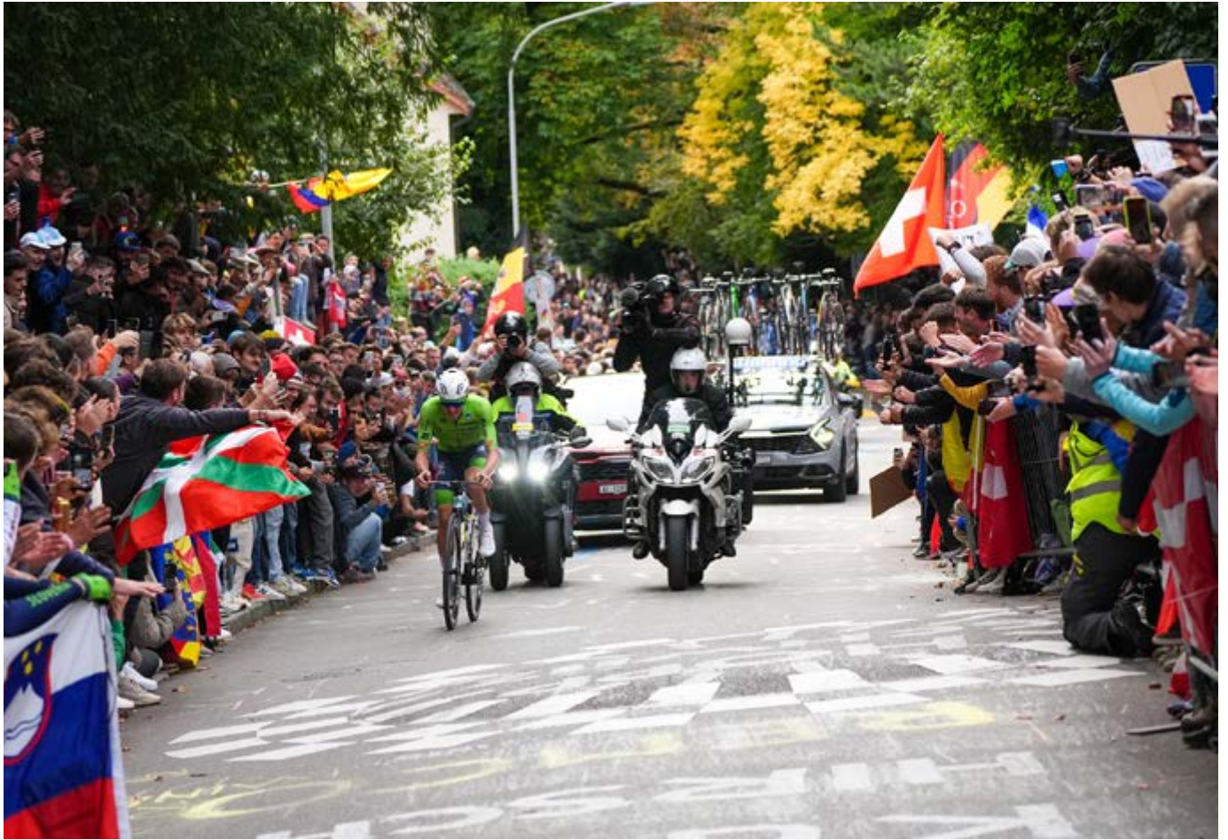
Die Zürichbergstrasse wurde während des Männer Elite-Rennens zum Tollhaus.