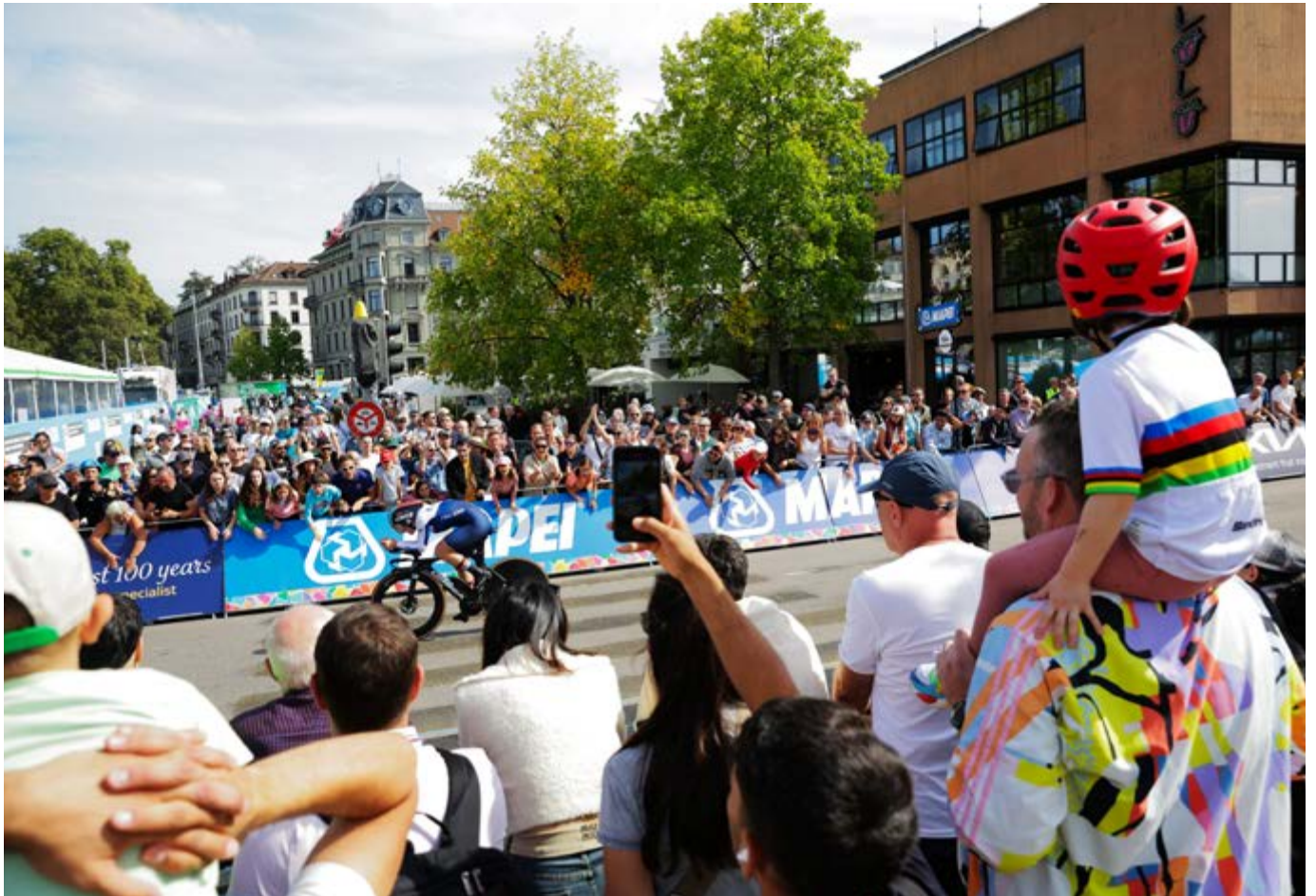
Auch Familien mit Kindern verfolgten die Rennen am Streckenrand.